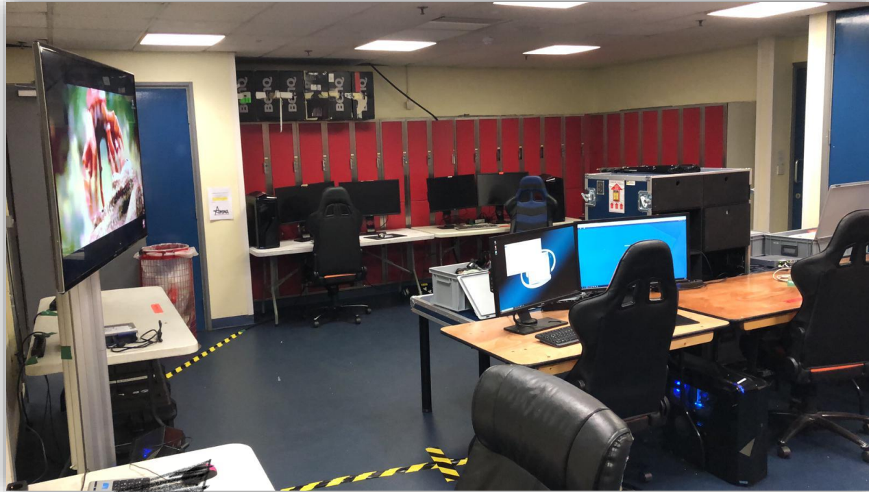
Umkleideraum wird zur Videozentrale