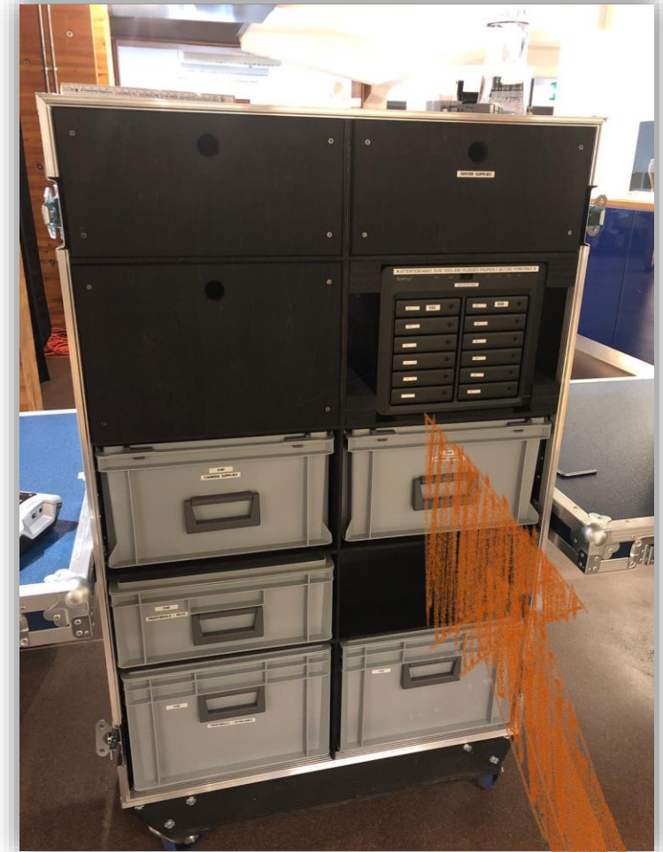
Synology im Flightcase